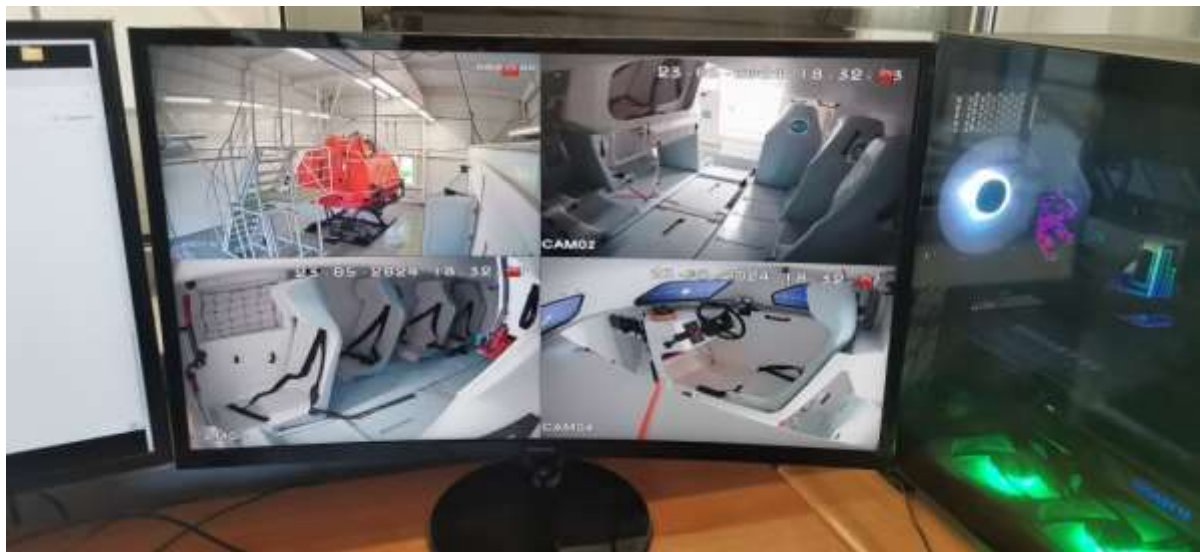
Пульт системы видеонаблюдения