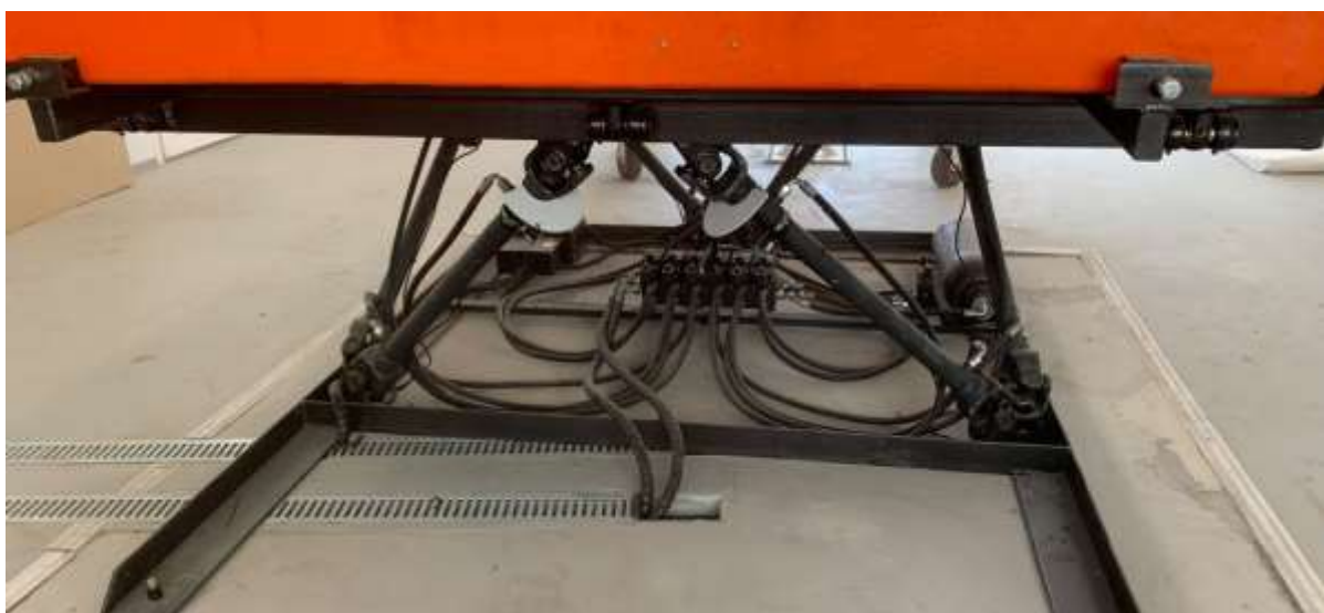
Динамическая платформа с 6 степенями свободы