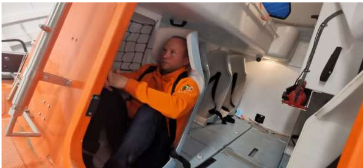
Слушатели пристегиваются ремнями безопасности