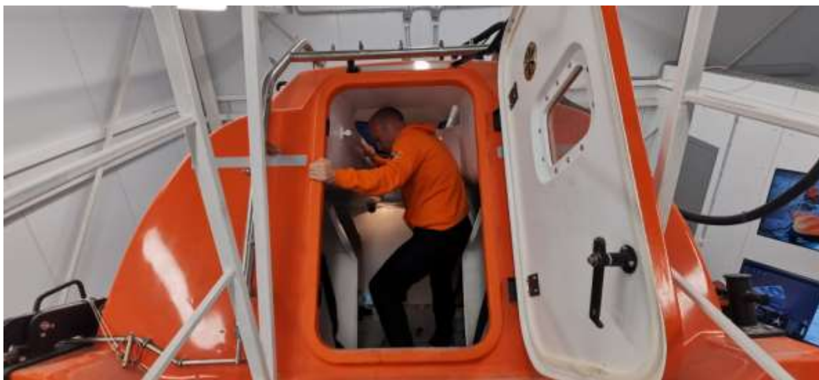
Слушатели осуществляют посадку в спасательную шлюпку