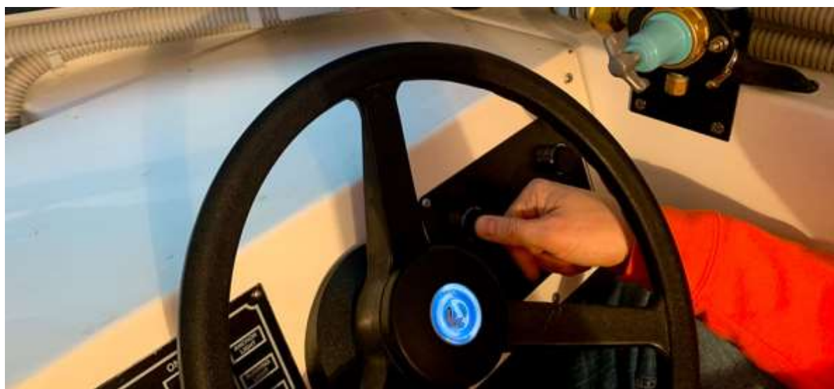
Рулевой запускает двигатель.