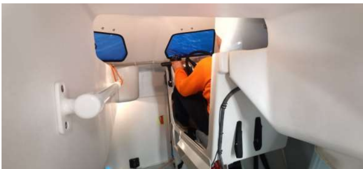
Рулевой занимает место за пультом управления.