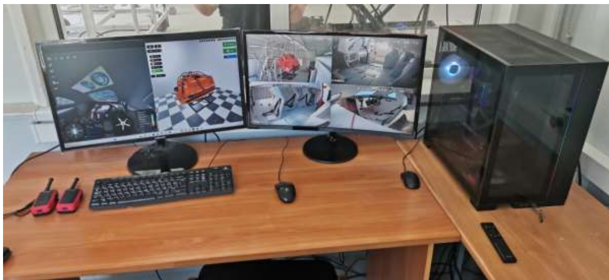
Рабочее место инструктора