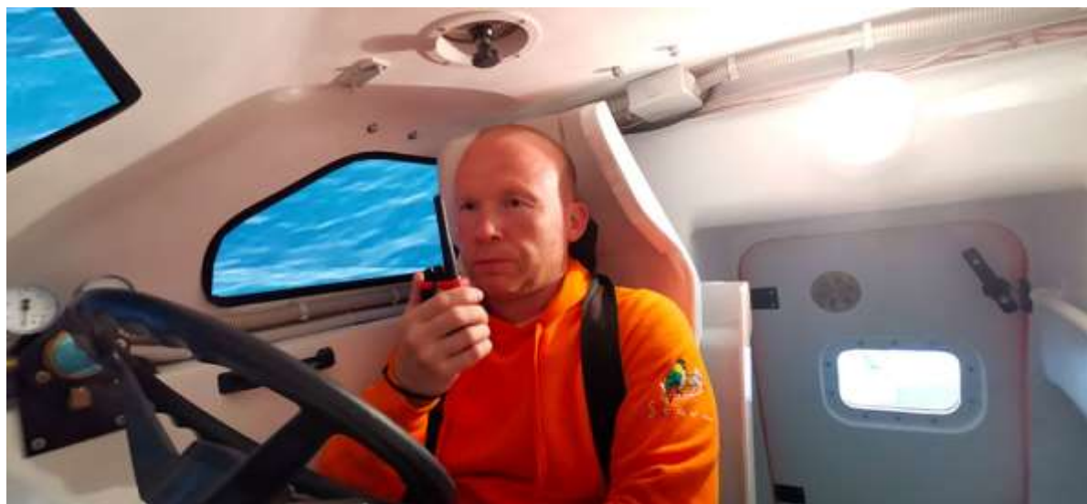
Рулевой занимает место за пультом управления.